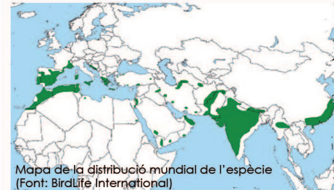
Mapa de la distribució mundial de l'espècie

A Europa, l'àguila coabarrada està considerada una espècie amenaçada a causa de la seva escassa població (entre 920 i 1.100 parelles), la qual, a més, va disminuir considerablement a gairebé tota l'àrea de distribució entre 1970 i 1990.