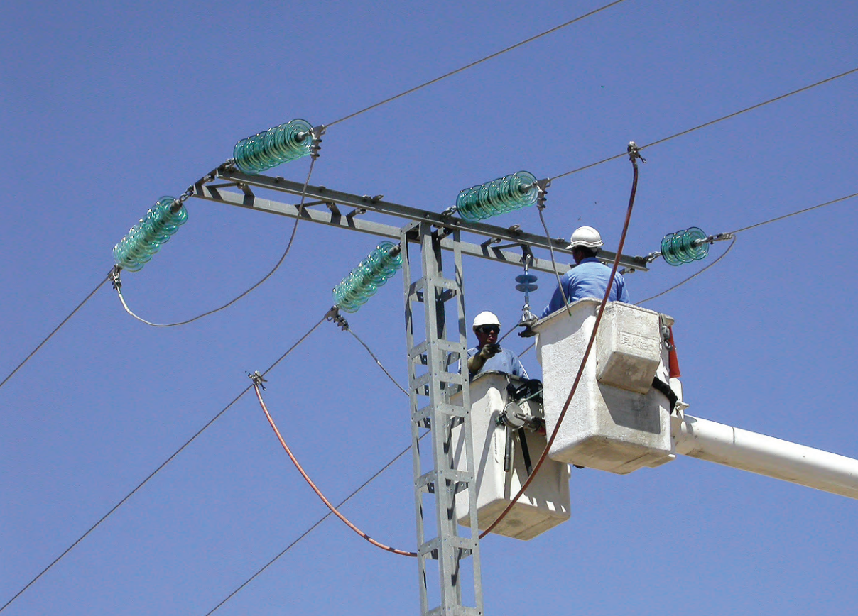
Figura 1.- Operarios realizando la modificación de una línea.

lo que cuestiona la utilidad de las mismas y debería llevar a replantear su uso sin una valoración rigurosa de su eficacia, y eventualmente a la modificación de la normativa básica antielectrocución (RD 1432/2008) en el sentido de considerar estos dispositivos como zonas de posada a los efectos del cálculo de distancias entre conductor y zona de posada y obtener un diseño de cruceta de la mayor seguridad posible. Por el momento, esta "ambigüedad" legal lleva a un gran gasto económico sin que se garantice la resolución del problema, lo que supone un uso poco eficiente de los recursos disponibles (en su mayor parte fondos públicos).