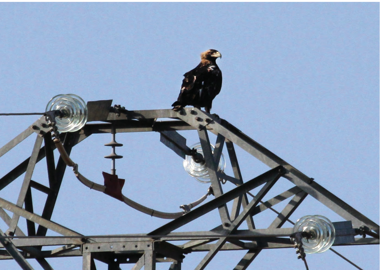
Figura 3.- Águila imperial en un apoyo de línea eléctrica.