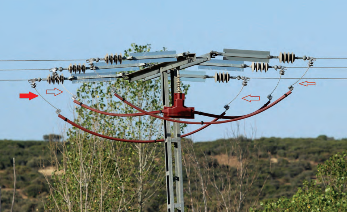
Figura 2.- Ejemplo de medidas antielectrocución.