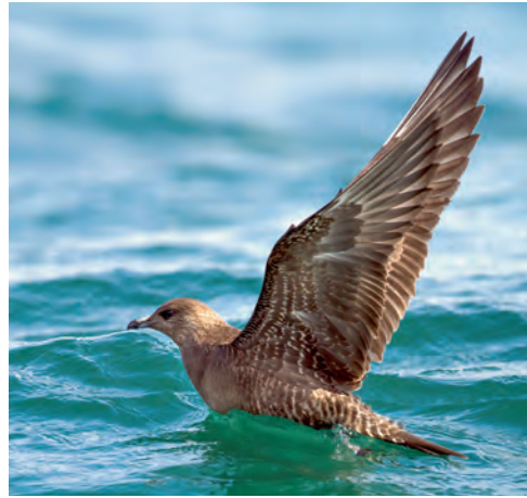
Abb. 10. Falkenraubmöwe Stercorarius longicaudus 1.KJ, intermediäre (links) und dunkle Morphe (rechts). Die 21 auf dem Bodensee rastenden Individuen zeigten einen Grossteil der Variationsbreite des Jugendkleids dieser Art, wie hier die Zeichnung von Unterflügel, Oberschwanzdecken und Handschwingenbasen. Bodensee zwischen Romanshorn TG und Friedrichshafen D, 29. August 2012, J. Landolt (links) und 2. September 2012, R. Martin (rechts). – Long-tailed Jaeger Stercorarius longicaudus 1 st cy, intermediate (left) and dark morph (right). The 21 individuals roosting on Lake Constance illustrated the variation in juvenile Long-tailed Jaegers (uppertail coverts, underwing and primary base patterns). Lake Constance between Romanshorn (canton of Thurgau) and Friedrichshafen (Germany), 29 August (left) and 2 September 2012 (right).

J. Landolt, B. Sutter), 1. September, mind. 16 Ind. 1.KJ, Foto, Video (S. Werner, K. Varga, M. & B. M. Hemprich), 2. September, 9 Ind. 1.KJ, 4./16. September, 4 Ind. 1.KJ, 5. September, 6 Ind. 1.KJ, 7./9. September, 3 Ind. 1.KJ, 10./15. September, 2 Ind. 1.KJ, 11./21./23. September, 1 Ind. 1.KJ, Foto in Ornis 5/12: 26 und in Limicola 20: 153, 2012, Abb. 10–12 (M. Hochreutener, J. Hochuli, D. Marques, N. Orgland, S. Trösch et al.).