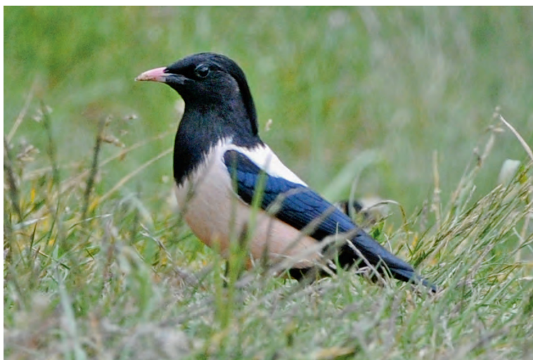
Abb. 18. Rosenstar Sturnus roseus ♂ ad. Dieser Altvogel zeigt die vollständig glänzend schwarzen Flügeldecken, während immature Vögel im 2. KJ noch unvermauserte und nicht glänzende Flügeldecken haben. Guarda GR, 31. Mai 2012. – Rosy Starling Sturnus roseus ad. ♂. This adult shows glossy black wing coverts, while immature 2 nd cy birds have unmoulted, dull wing coverts. Guarda (Grisons), 31 May 2012.

Wie im Vorjahr ein überdurchschnittliches Auftreten des Rosenstars in unserem Land mit drei Nachweisen an typischen Daten und Orten für diese im Spätfrühling aus Südosteuropa einfliegende Art.