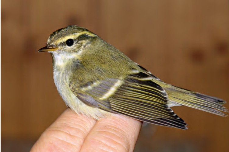
Abb. 15. Gelbbrauenlaubsänger Phylloscopus inornatus . Col de Bretolet VS, 12. Oktober 2012. M. Thoma. – Yellow-browed Warbler Phylloscopus inornatus . Col de Bretolet (Valais), 12 October 2012.

Zweitstärkstes Auftreten dieser ostpaläarktischen Art seit 2008, als vier Nachweise erfolgten (Schweizer & Thoma 2009). Die Beobachtungen reihen sich in das bisherige Auftretensbild der Art in der Schweiz ein. Von den 19 Schweizer Nachweisen fielen 17 in die Zeit vom 28. September bis 18. Oktober. Somit entspricht die Phänologie jener in Nord- und Nordwesteuropa. Auf der Nordseeinsel Helgoland D kulminiert das Auftreten ebenfalls Ende September und Anfang Oktober (Median: 5. Oktober; Dierschke et al. 2011). Auf dem Col de Bretolet, wo rund ein Viertel aller Schweizer Nachweise erbracht worden sind, wurde die Art 2012 im dritten aufeinanderfolgenden Jahr beringt (Thoma & Althaus 2013).