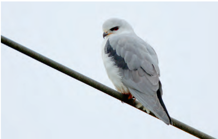
Abb. 3. Gleitaar Elanus caeruleus mind. 2.KJ. Meinisberg BE, 21. November 2012. P. Donini. – Black-shouldered Kite Elanus caeruleus at least 2 nd cy. Meinisberg (canton of Berne), 21 November 2012.

Überdurchschnittliches Auftreten mit einer neuen Höchstzahl von fünf Nachweisen und acht Individuen, die sich im Gegensatz zu den Vorjahren ausschliesslich auf das Frühjahr beziehen. Die Art hat im südfranzösischen Brutgebiet seit 2006 massiv zugenommen und ihr Brutgebiet ausgedehnt (Dubois et al. 2012), womit die Zunahme der Nachweise in der Schweiz zusammenhängen dürfte. Als Fallbeispiel dient jener Vogel von Yverdon und Cha-