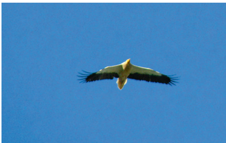
Abb. 4. Schmutzgeier Neophron percnopterus ad. Sigriswil BE, 4. Mai 2012. A. und R. Mägli. – Egyptian Vulture Neophron percnopterus ad. Sigriswil (canton of Berne), 4 May 2012.

Frühjahrsnachweise des Schmutzgeiers gelangen bisher zwischen Mitte März und Ende