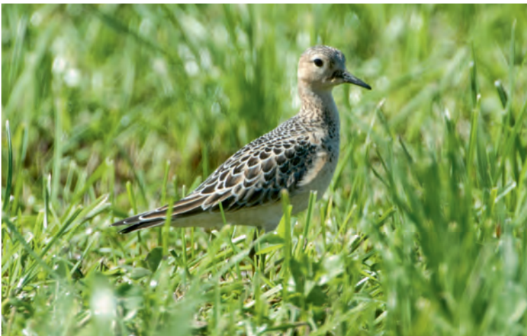
Abb. 8. Grasläufer Tryngites subruficollis 1.KJ, Nuolener Ried SZ, 2. September 2012. M. Ruppen. – Buff-breasted Sandpiper Tryngites subruficollis 1 st cy. Nuolener Ried (canton of Schwyz), 2 September 2012.

TG – Bodensee zwischen Romanshorn und Friedrichshafen D, 7./9. September, 1 Ind. 2.KJ und 2 Ind. 1.KJ, Foto in Limicola 20: 153, 2012 (M. Bauer, S. Bigler, H. Klopfenstein, J. Landolt, R. Martin et al.), 10. September, 1 Ind. 1.KJ, 11./16. September, 1 ad. helle