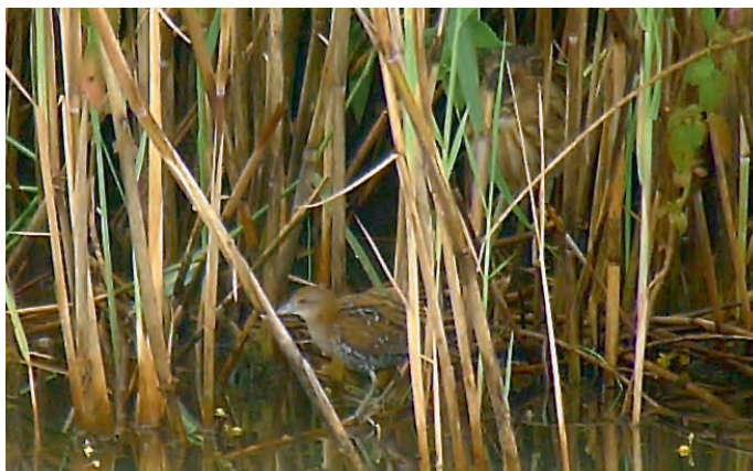
Abb. 7. Zwergsumpfhuhn Porzana pusilla 1.KJ und (im Hintergrund) Zwergdommel Ixobrychus minutus . Riedikerried/Uster ZH, 16. August 2012. R. Zanelli. – Baillon's Crake Porzana pusilla 1st cy and (in the background) Little Bittern Ixobrychus minutus. Riedikerried/Uster (canton of Zurich), 16 August 2012.

– Pfynwald, 14. Juli, ♂ singend (A. Gander).