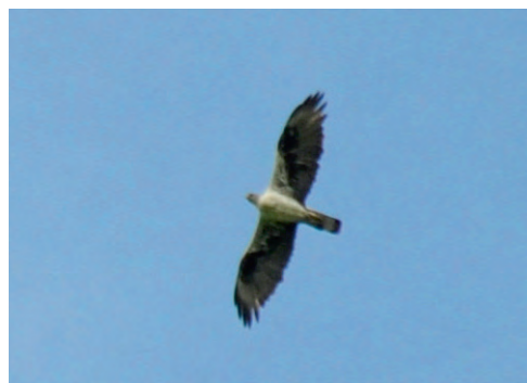
Abb. 6. Habichtsadler Aquila fasciata mind. 3.KJ. Moutier BE, 8. Juli 2012. – Bonelli's Eagle Aquila fasciata at least 3 rd cy. Moutier (canton of Berne), 8 July 2012.

VS – Chamoson, 18. Mai, ♂ singend (Y. Bötsch, M. Tschumi).