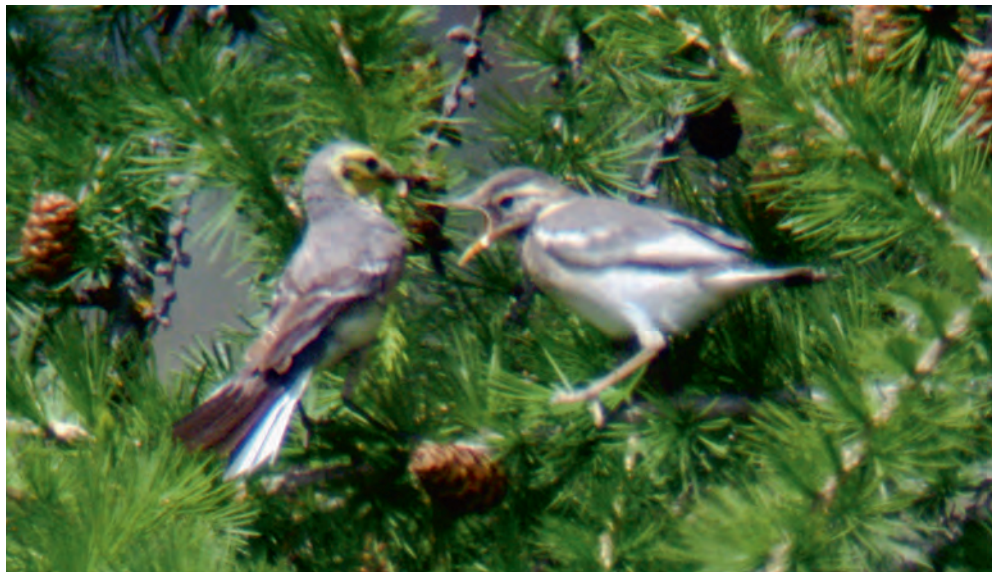
Abb. 14. Zitronenstelze Motacilla citreola ♀ 2.KJ beim Füttern eines Jungvogels. Der grosse Weissanteil auf den Mittleren Armdecken und den Schirmfedern sowie die graue Oberseite des Jungvogels sind etwas ungewöhnlich für juvenile Zitronenstelzen und könnten auf eine Hybridisierung hinweisen. Graubünden, 10. Juli 2012. D. Jenny. – Citrine Wagtail Motacilla citreola ♀ 2 nd cy feeding a juvenile. The amount of white on median coverts and tertials seems unusual for juvenile Citrine Wagtails and might thus indicate hybridization. Grisons, 10 July 2012.

Überdurchschnittliches Auftreten der Zitronenstelze mit einem Brutnachweis als Höhepunkt, dem zweiten für die Schweiz nach einer erfolglosen Brut eines Zitronenstelzenpaars im Jahr 1997 im Ägerried ZG (Glutz von Blotzheim 1997). Im Engadin zog ein vorjähriges ♀ erfolgreich vier Junge auf, wobei es sich um eine Mischbrut mit einer anderen Stelzenart gehandelt haben könnte. Es wurde nie ein ♂ beobachtet und die flüggen Jungvögel zeigten eine etwas ungewöhnliche Merkmalskombination (Abb. 14).