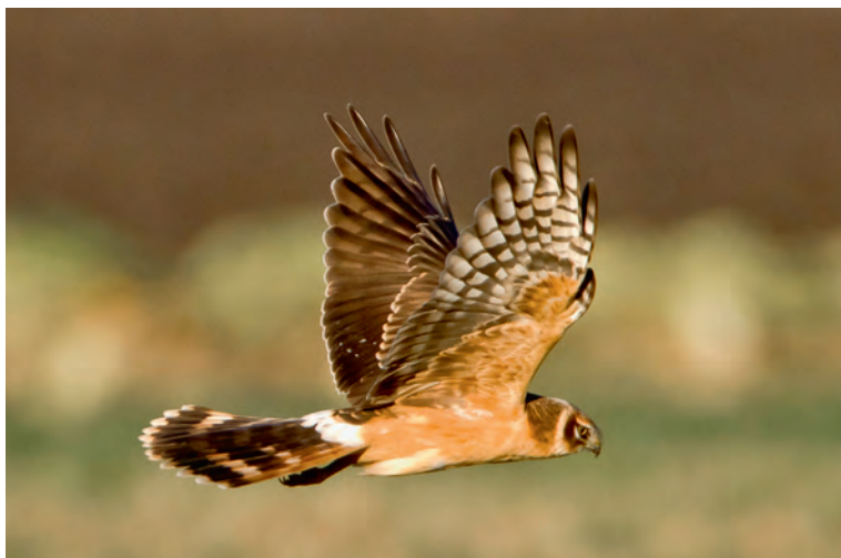
Abb. 5. Steppenweihe Circus macrourus ♂ 2.KJ. Dieser Vogel versuchte bei uns zu überwintern. Es ist ein junges ♂, dessen Geschlecht anhand der hellen Iris zu erkennen ist. Müntschemier BE, 10. Januar 2012. – Pallid Harrier Circus macrourus ♂ 2 nd cy. This individual tried to overwinter in Switzerland. It was a juvenile male, which can be sexed by its pale iris. Müntschemier (canton of Berne), 10 January 2012.

GR/SG – Furna, 17. November, 1.KJ (R. & D. Altenburger); Oberriet und Balgach, 21.–24. November, 1.KJ farbringend NF