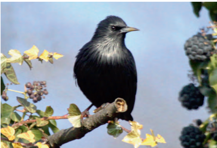
Abb. 17. Einfarbstar Sturnus unicolor . Clarens VD, 29. Januar 2011. A.-C. Tosoni. – Spotless Starling Sturnus unicolor . Clarens (Vaud), 29 January 2012.

LU – Geuensee, 16. Juli – 2. August, ♂, Foto (H. Schmid et al.).