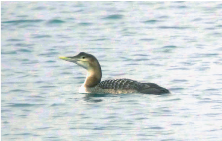
Abb. 1. Gelbschna- beltaucher Gavia adamsii 2.KJ. Güttingen TG, 13. Februar 2012. S. Trösch. – Yellow-billed Loon Gavia adamsii 2 nd cy. Güttingen (canton of Thurgau), 13 Febru- ary 2012.

TG – Arbon und Romanshorn, 17./19. Fe- bruar, 2.KJ, Foto (M. Thoma et al.). – Kesswil, 21. März, Foto (F. Ammann). – Güttingen, 30. April, Foto (M. Sauter); Uttwil, 5. Mai, Foto (S. Trösch).