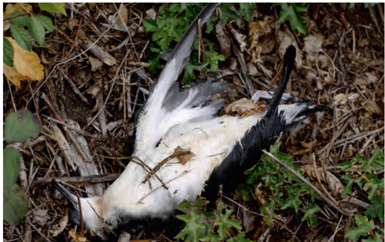
Abb. 2. Schwarzschnabelsturmtaucher Puffinus puffinus tot gefunden. Thalheim AG, 26. September 2012. G. Dusej. – Manx Shearwater Puffinus puffinus found dead. Thalheim (canton of Aargau), 26 September 2012.