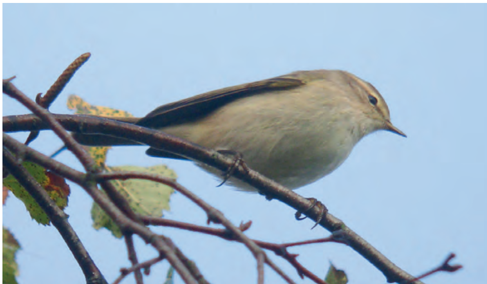
Abb. 16. Zilpzalp mit Merkmalen der Unterart Phylloscopus collybita tristis . Das Fehlen von Grün- und Gelbtönen auf Unter- und Oberseite, schwarze Beine und der cremefarbene Überaugenstreif sind typisch für diese Unterart, während die Schnabelkanten eher etwas hell wirken. Tonaufnahmen des typischen Rufs machten die Bestimmung dieses Individuums möglich. Büsisee/Zürich, 19. Oktober 2012. P. Walsler Schwyzer. – Common Chiffchaff with the characteristics of Phylloscopus collybita tristis . Typical for this taxon are the missing yellow and green tones on under- and upperparts, black legs and the buffy supercilium, while the bill seems rather pale. A recording of the typical call clinched the identification of this individual. Büsisee/Zurich, 19 October 2012.

Im Frühjahr 2012 fand ein bemerkenswerter Einflug des Halsbandschnäppers nördlich der Alpen statt. Beobachtet wurden mindestens 11 Individuen, darunter auch zwei singende ♂ im Mai. Herbstnachweise dieser Art gelingen in der Schweiz nur selten und beziehen sich meist auf gefangene Vögel (Maumary et al. 2007), da eine sichere Abgrenzung vom Trauerschnäpper im Herbst fast nur in der Hand möglich ist (Svensson 1992).