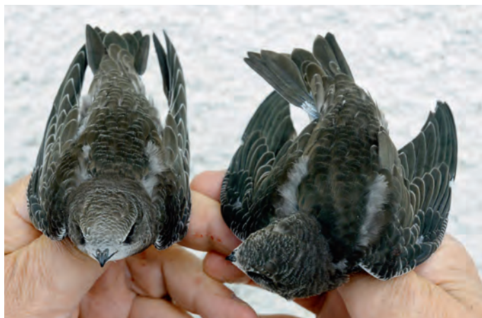
Abb. 13. Fahl- Apus pallidus × Mauersegler A. apus , fast flügge Jungvögel. Der linke, hellere Vogel zeigt mehr typische Merkmale eines Fahlseglers, während der rechte Vogel eher einem Mauersegler ähnelt. Tramelan BE, 12. Juli 2012. A. Gerber. – Pallid Apus pallidus × Common Swift A. apus , almost fledged juveniles. The left, paler bird shows more traits typical of Pallid Swift, while the right bird resembles more a Common Swift. Tramelan (canton of Berne), 12 July 2012.

SG – Benken, 4. Mai, Foto (K. Robin). – Bannriet/Altstätten, 5. Mai, Foto (M. Hochreutener).