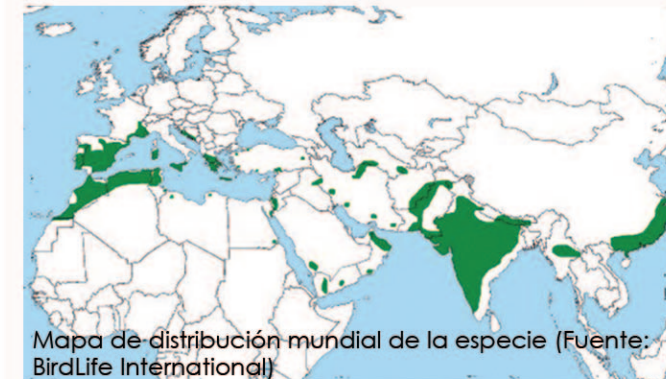
Mapa de distribución mundial de la especie

En Europa, el águila de Bonelli está considerada como una especie amenazada debido a su pequeño tamaño poblacional (920 a 1100 parejas) y a que experimentó un gran descenso en casi toda su área de distribución entre 1970 y 1990.