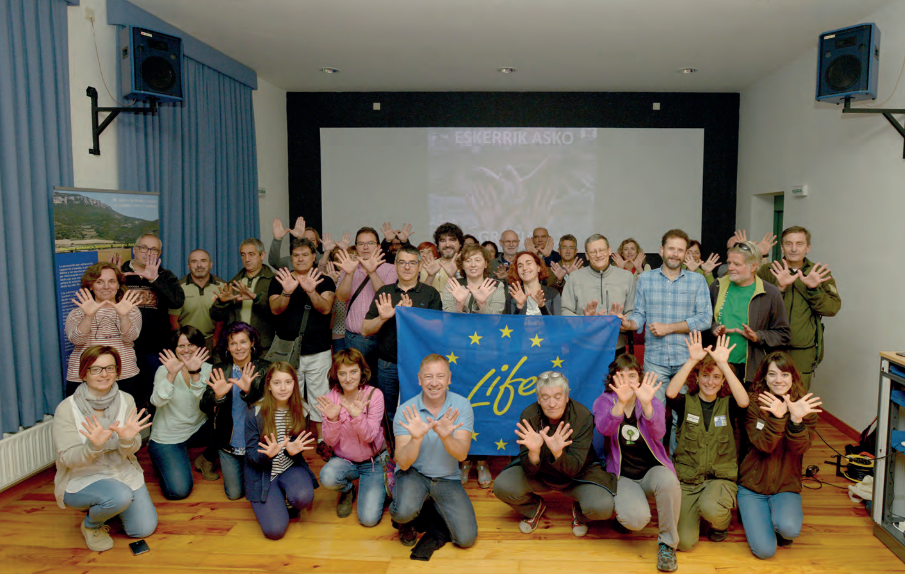
Argazkian, 2017ko maiatzaren 21eko jardunaldian parte hartu zuen jende guztia banderaren inguruan