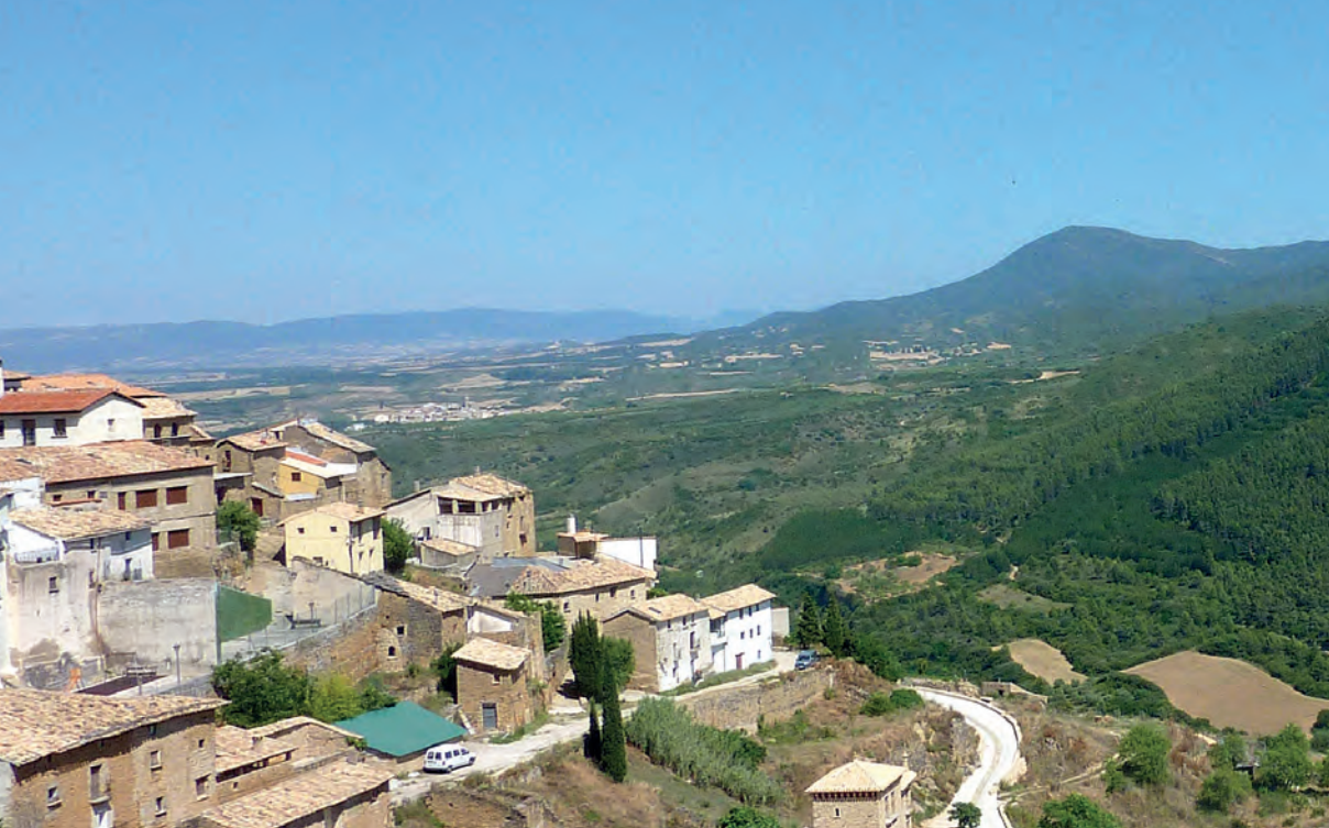
Figura 1.- El compromiso del municipio de Gallipienzo (Ayuntamiento, cazadores y población en general) ha sido fundamental, desde el principio, para la puesta en marcha y desarrollo de las acciones de conservación.

LIFE Bonelli ha previsto desde el inicio del proyecto la necesidad de abrir vías de colaboración y participación con los colectivos de cazadores, agricultores y ganaderos, además de otros agentes políticos y sociales, que actúan o tienen intereses relacionados con la conservación del águila de Bonelli en las áreas donde se van a desarrollar las acciones de conservación.