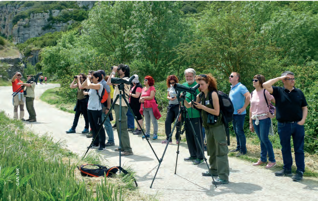
Figura 13.- Jornada de presentación de LIFE Bonelli en Lumbier (observando las águilas liberadas).