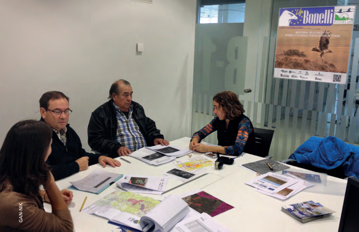
Figura 2.- Reunión de trabajo de técnicos ambientales y de caza, con asociaciones de cazadores.

mayoría criados en cautividad o cedidos por los centros de recuperación de fauna silvestre. También es objeto del proyecto, restaurar hábitats de calidad para la especie y seguir trabajando para minimizar los riesgos que la amenazan.