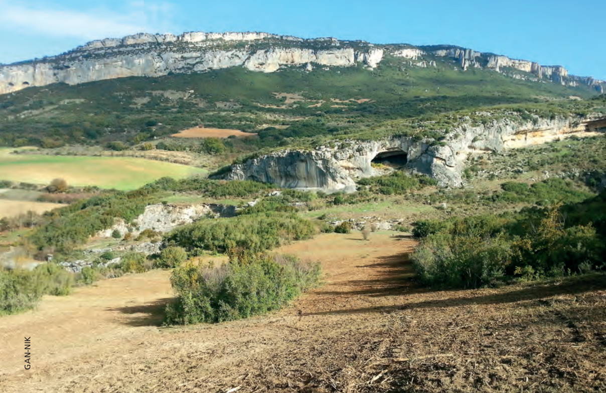
Figura 7.- Paraje de La Piedra

vez de obtener un mosaico pastizal/matorral que era imposible mantener sin ganado. Los cazadores asumen estas actuaciones como propias y el Ayuntamiento se compromete a su mantenimiento, en el marco del cumplimiento de la Ley Foral 17/2005, de 22 de diciembre, de Caza y Pesca de Navarra, que en su Artículo 20, Deberes del titular del coto. Apartado.1 d) dice: “Invertir el 25 por 100 de los ingresos obtenidos en el aprovechamiento del coto en la mejora de las poblaciones animales y sus hábitats.” Por otro lado, el Ayuntamiento de Gallipienzo firmó un compromiso de apoyo al mantenimiento de estas medidas.