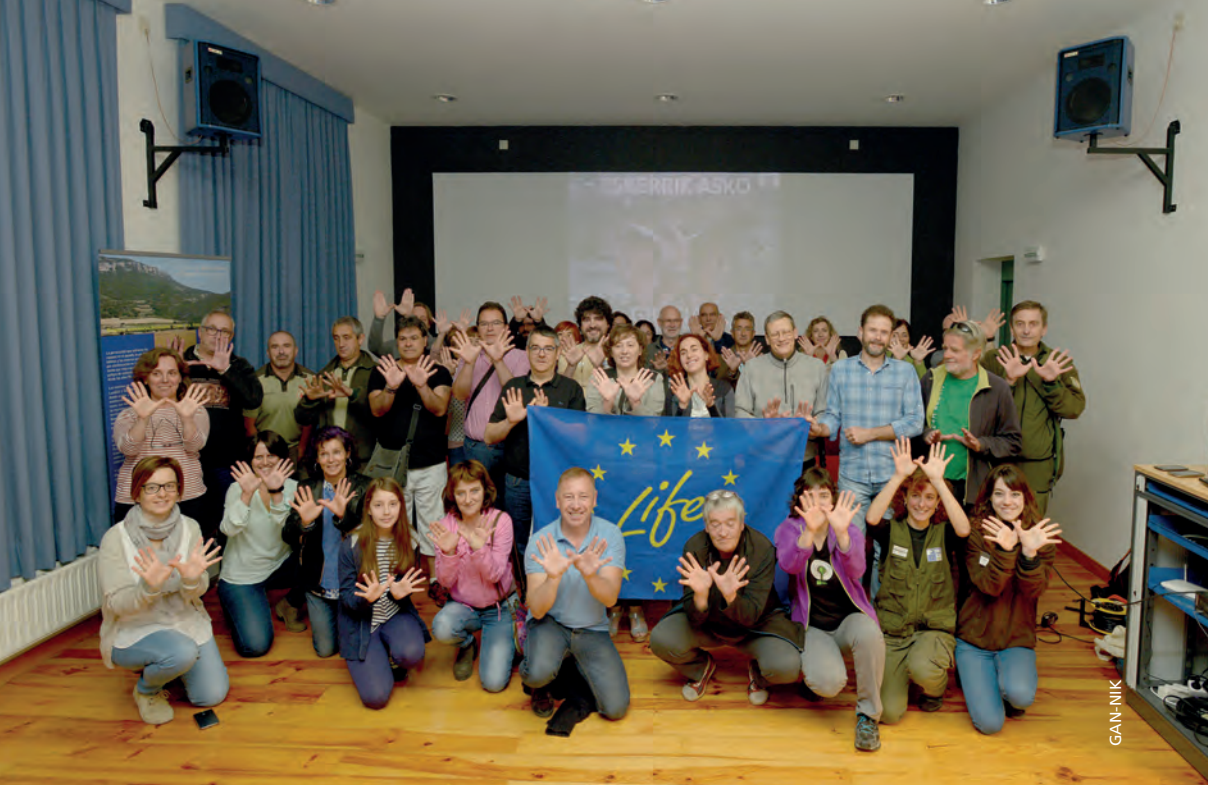
Figura 14.- Gran parte de las entidades y personas colaboradoras con Bonelli, celebrando el Día Europeo de la Red Natura 2000 (Lumbier, 21 de mayo de 2017).