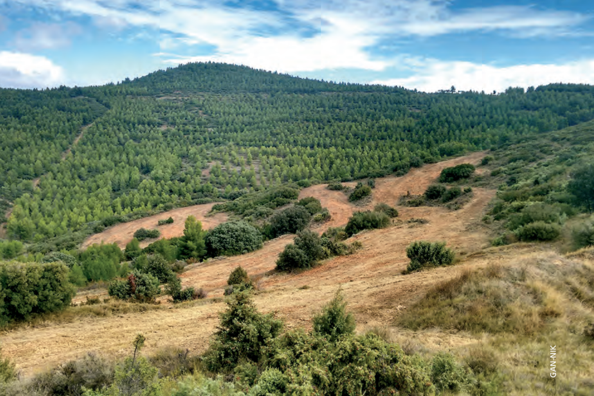
Figura 6.- Áreas desbrozadas en Gallipienzo.

parcela dejando las zonas exteriores para el desarrollo de vegetación natural. Se sembraron un total de 7,16 ha, con una mezcla de semillas (todas certificadas como semillas ecológicas) compuesta por gramíneas (50% esparceta y 45% trigo) y leguminosas (5% guisante).