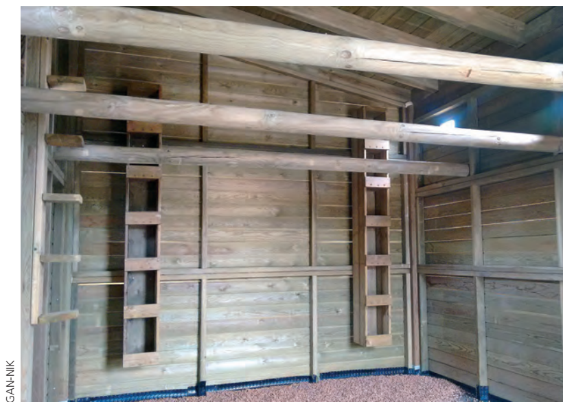
Figura 10.- Exterior e interior del palomar construido en Egubelea (Gallipienzo).