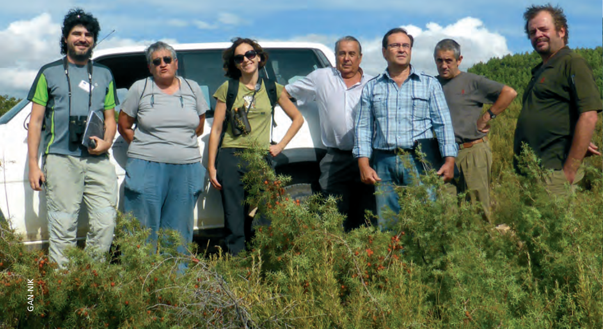
Figura 5.- Visita de campo de técnicos, alcaldesa y cazadores de Gallipienzo.