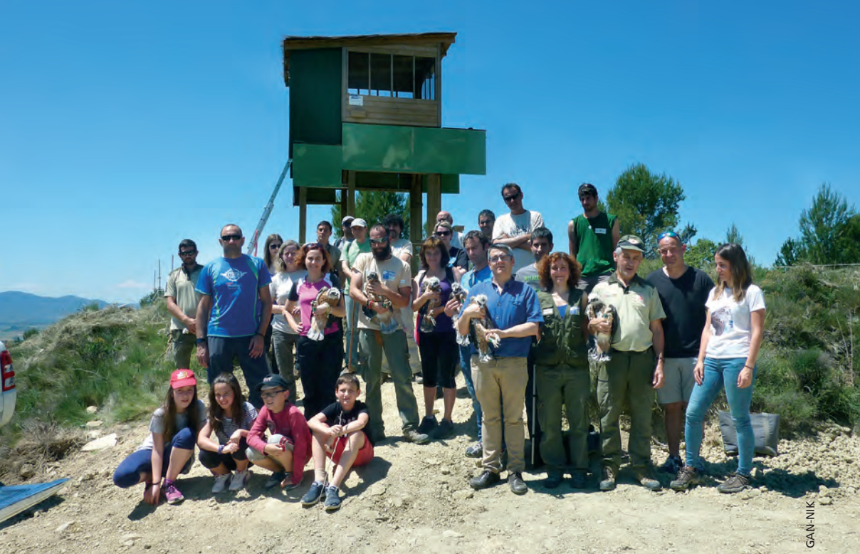
Figura 3.- Técnicos y colaboradores de distintos sectores de la población local participando en la liberación de pollos (Sangüesa 2017).