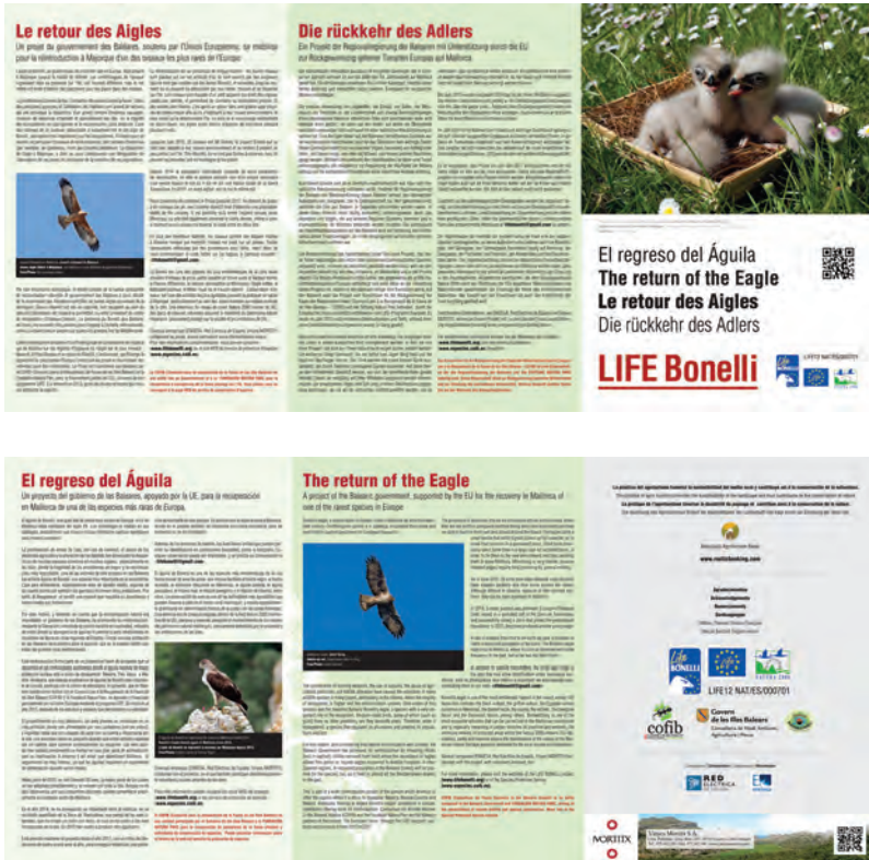
Figura 6.- Documentación específica del proyecto en 4 idiomas para agroturismos. Repartida a todos los agroturismos de Mallorca por parte de la Asociación Balear de Agroturismos y Turismo de Interior.