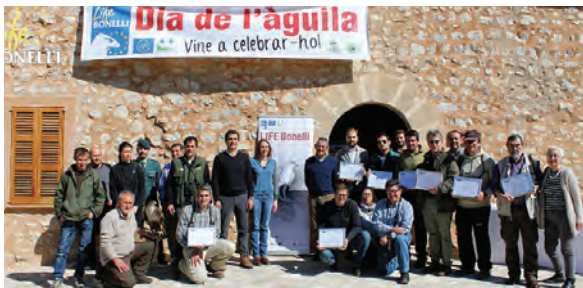
Figura 3.- Entrega de diplomas de reconocimiento a los miembros de la red de apoyo, PN Levant 2015.

El Día del Águila, se anunció en prensa local y se celebró anualmente, abierto al público. Constituyó el acto social anual más importante del proyecto LIFE Bonelli en Mallorca, aprovechando para nombrar los padrinos/madrinas del proyecto y reconocer la implicación de los miembros de la red de apoyo. También se prepararon talleres para los más pequeños, se realizaron actividades y charlas sobre el proyecto facilitando documentación y merchandising. Con el apoyo de entidades de cetrería se podía observar un águila de Bonelli.