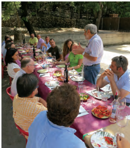
Figura 7.- En junio del año 2016 se recibió la visita del equipo de seguimiento de la UE al proyecto. Cada representante explicó su punto de vista sobre el proyecto LIFE Bonelli durante una comida de la red de apoyo en la que participaron: UE, equipo de seguimiento, Conselleria de Medio Ambiente, ENDESA, Asociación Balear de Agroturismos, Departamento de caza del Consell de Mallorca, COFIB y Fundació Natura Parc. El inmejorable marco fue dispuesto por Vinyes Mortitx, entidad colaboradora del proyecto, que participa en la divulgación del mismo mediante la distribución de información, panel divulgativo e inclusión del

logo del LIFE Bonelli en algunos de sus vinos. En la finca de Mortitx se instaló la primera pareja de águilas de Bonelli del proyecto de reintroducción que crió de forma natural en la isla.