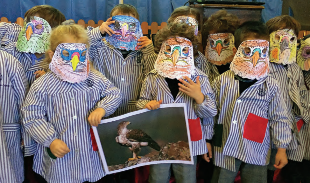
Figura 4.- Actividades educativas realizadas con los más pequeños.