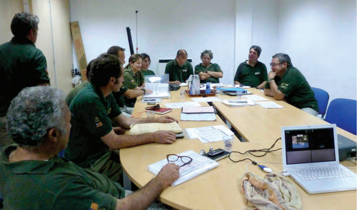
Figura 2.- Reunión con los Agentes de Medio Ambiente en mayo de 2013 para la implicación y complicidad en el proyecto.