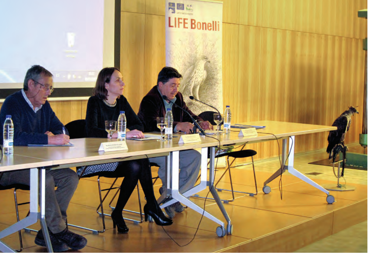
Figura 5.- La conferencia de Miguel Delibes “Linces, águilas y conservación creativa”, invitado dentro de los actos del Día del Águila del año 2015, congregó a unas 150 personas de todos los sectores implicados en la conservación del águila de Bonelli. Consiguiendo aunar conservación, caza e investigación. Fue reconocido públicamente como padrino del proyecto. Para la organización del acto, se realizaron medio centenar de llamadas de teléfono a representantes de sociedades de cazadores y personas relevantes del mundo cinegético mallorquín invitándoles personalmente a esta conferencia, lo que sin duda redundó en el éxito de la convocatoria.