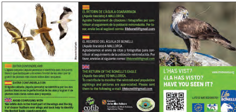
Figura 1.- Ejemplo de folleto del que se repartieron 10.000 uds. y que no obtuvo los resultados esperados, al no conseguir volumen suficiente de citas de la especie.

En el otro lado estarían los medios unidireccionales, como la información en folletos, trípticos, revistas, notas de prensa... que siendo más o menos atractivos, han sido redactados en un único lenguaje y no siempre han dado los resultados esperados, aunque puedan ser necesarios para una presentación general del proyecto.